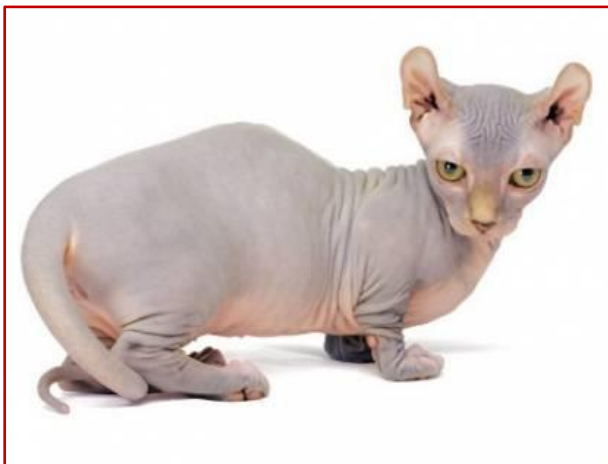
Figure 8 : Race Dwelf (Origine : USA)

Exemples : Race Dwelf (USA. De 15 à 18 cm), Bambino (16-20cm).