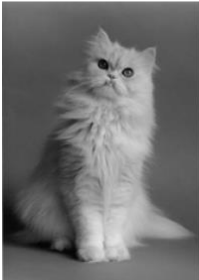
Figure 1 : Persan (En. Persan cat ; 80 variétés)