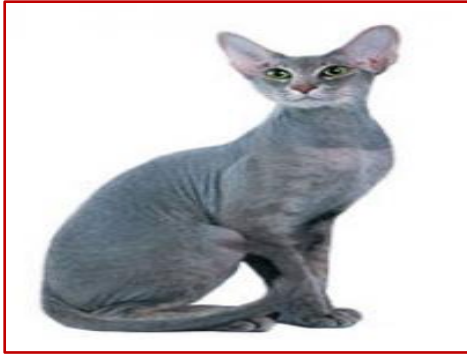
Figure 13 : Peterbald (Meyer, 2024 ; cirad)