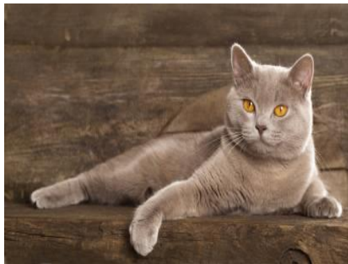
Figure 19 : Robe Lilac (Lilas)

La couleur doit être uniforme, sans poils blancs ni marques. Le sous-poil ne peut pas être gris.