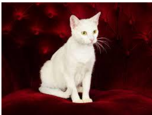
Figure 22 : Le Khao Manee (Standard. CFA. ©2024 The Cat Fanciers' Association, Inc. ® ; Khao Manee Miscellaneous Show Standard 2022)