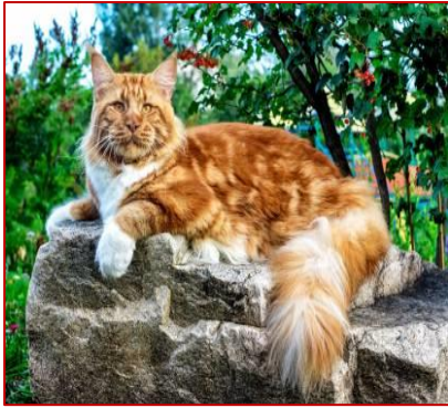
Figure 20: Robe Red (Rouge; motifs tabby)