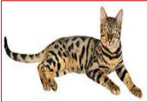
Figure 10 : Bengal (Standard Fife : Poil court à moyen Ben-2/ 01-01-2024).