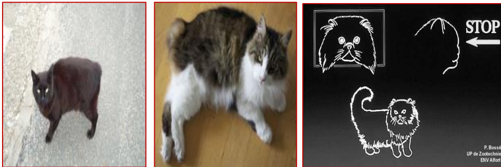
Figure4 : Figure 4 : type de chats concaveligne à tête rectangulaire (A droite Boukhechem, 2023 ; Race Manx à gauche ; Cymric au milieu Meyer, 2024 ; cirad).

Exemples : Le Burmese Américain, le Cymric, l'Exotic Shorthair, le Manx et le Persan