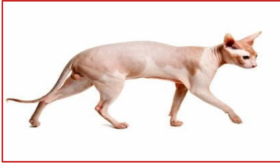
Figure 12: Race Peterbald (Russie. Standard FIFe: Rec-Anerk, 2012 pep -1 /01-01-2024).