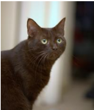
Figure15: Havana Brown (Meyer,2024; cirad)

Exemples : le Havana Brown et le Burmese Anglais.