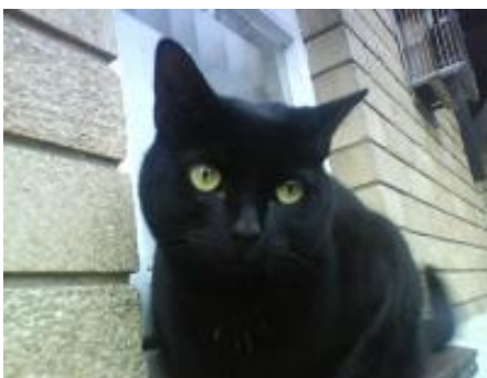
Figure 2 : Chat de Bombay (Meyer, 2024 ; cirad)

L'American Shorthair, le Devon Rex, l'American Wirehair, le Birman, le Bombay, le Singapura, le British Shorthair, le Chartreux, le Korat, le Scottish Fold, le Sphynx et le Turkish Van .