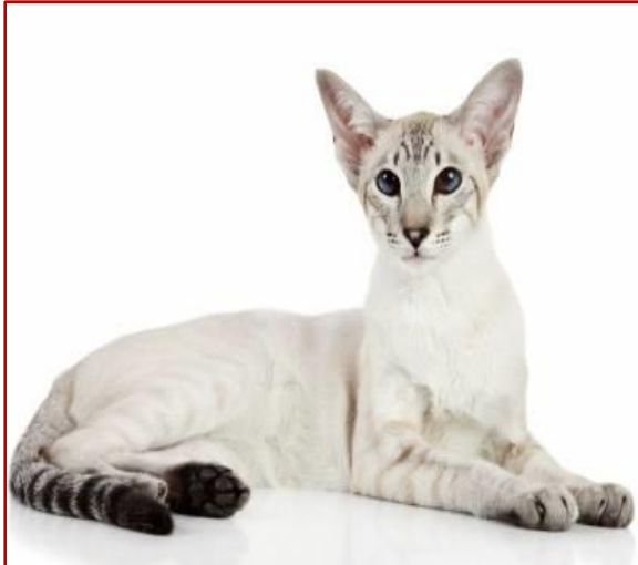
Figure 9 : Mandarin (Meyer, 2024, cirad ; Standard : GCCF).