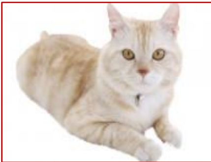
Figure 21 : Robe Crème (motifs tabby)

Tonalité pastel uniforme. Elle doit être pâle et régulière. La couleur crème présente souvent des motifs tabby . Les yeux sont orange ; le cuir du nez, les coussinets et les lèvres sont roses.