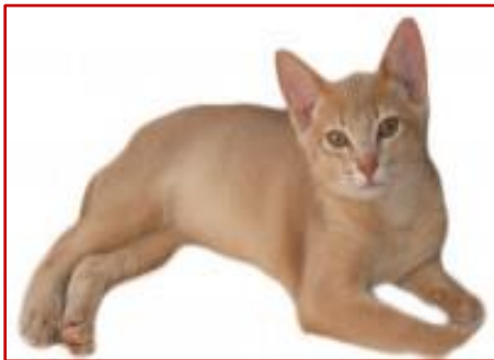
Figure17 : Robe Fawn

Est une teinte caramelle (tirant vers le beige pâle). Il s'agit d'une version diluée du cinnamon