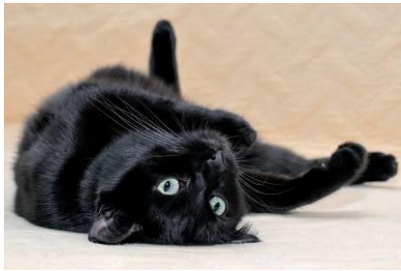
Figure 14 : Le Bombay (Meyer,2024 ; cirad)

La robe noire est intense, brillante et unie de la pointe à la racine (pas d'ombre rousse, pas de poils blancs ou gris, pas de reflet). Le ton gris est cependant admis chez les chatons. Les yeux peuvent être or ou verts. Le nez, les coussinets et les lèvres sont noirs ou bruns. Il existe deux couleurs de robe qui sont en fait des dilutions du noir :