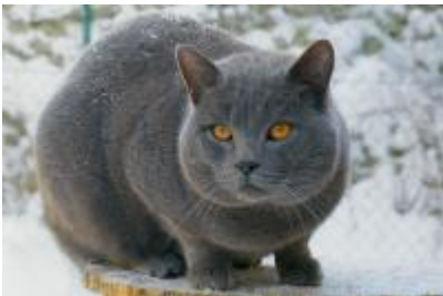
Figure 18 : Le Chartreux (Meyer,2024 ; cirad)