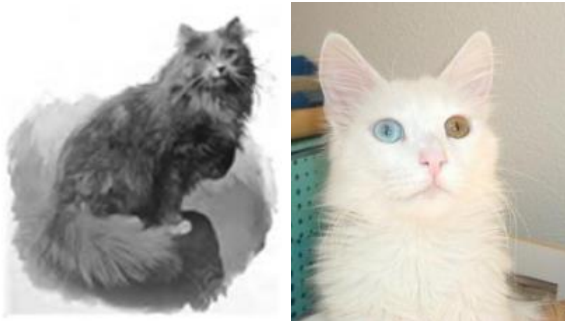
Figure 11 : race Angora turc (Meyer, 2024, cirad)