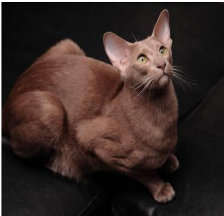
Figure 16 : Oriental Shorthair (Angleterre)

Est une teinte caramelle (tirant vers le beige pâle). Il s'agit d'une version diluée du cinnamon