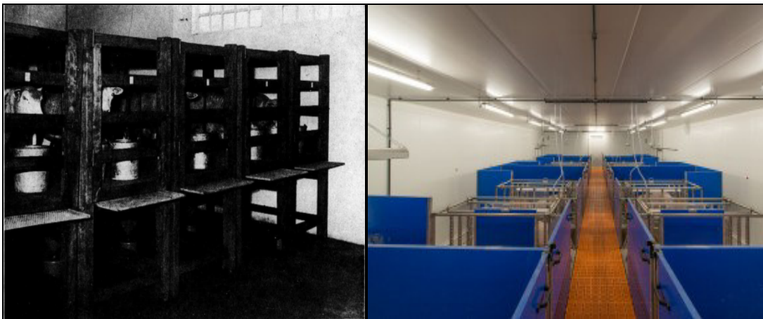
Figure 1: Cage de digestibilité

2.1.1. Méthode in vivo : C'est une mesure directe sur un animal vivant, maintenu en cage (cage de digestibilité) ayant reçu un aliment déterminé. Les quantités d'aliments ingérées et les fécès rejetées sont pesées et analysées (on peut estimer également les différents constituants d'un ou plusieurs aliments).