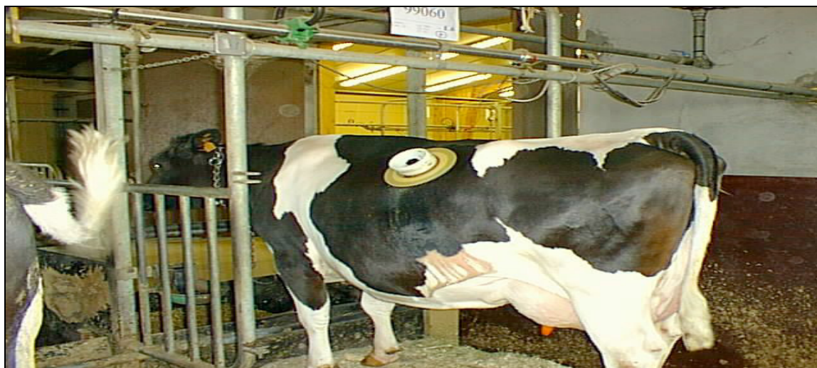
Figure 2 : Méthode in sacco, vache fistulée

2.1.3. Méthode in vitro : Cette méthode consiste à simuler et à reproduire le processus de dégradation subi dans le tractus digestif de l'animal dans un tube de verre en présence de jus de rumen.