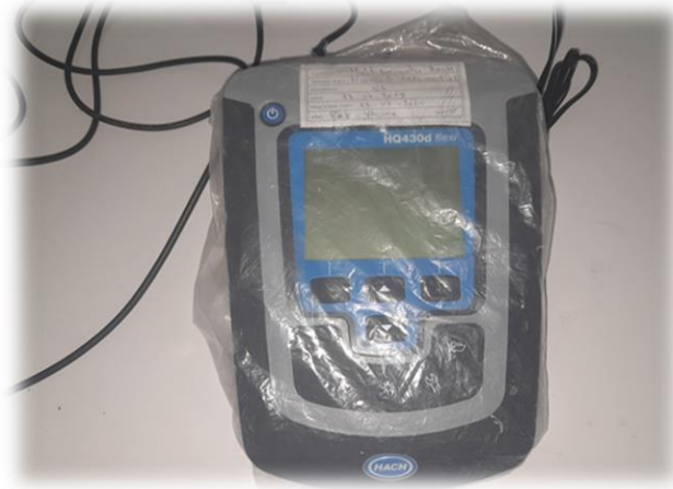
Figure 15 : Oxymètre de type (Hach HQ 430d flexi)