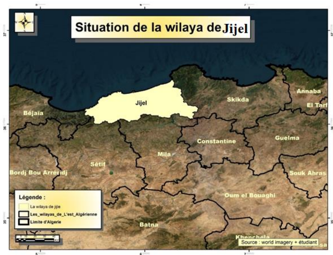
Figure 07 : Situation géographique de la wilaya de Jijel

Les huileries ayant fait l'objet de cette étude sont localisées dans la wilaya de Jijel située à 300 km de la capitale Alger. Elle est limitée au nord par la mer Méditerranée, à l'ouest par la wilaya de Béjaïa, à l'Est par la wilaya de Skikda, et au sud par la wilaya de Mila (Figure 07)