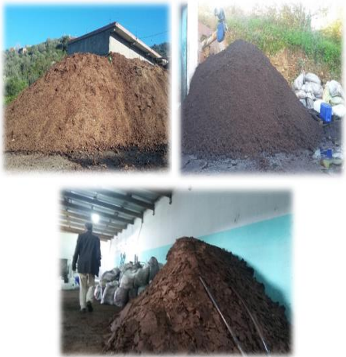
Figure 04 : Stockage des déchets de grignons au niveau de l'huilerie d'El baraka (Kaous)

La figure 04 illustre les déchets de grignons d'olives. Ces photos ont été prises au niveau de l'huilerie d'El baraka à Kaous. Plus de détails sont donnés sur cette huilerie en chapitre 2.