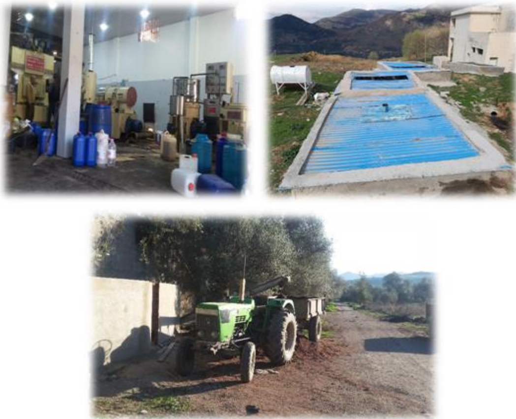
Figure 09 : Etat des lieux au niveau de l'huilerie Wassif

La chaîne d'extraction de l'huile d'olive utilisée est de type RAPANELLI . Cette chaîne est moderne et est composée de bascule, de tapis élévateur à vis, de laveuse, de broyeur, de malaxeurs, de décanteur, de séparateur centrifuge, de chaudière à gaz de ville, et de transporteur à vis pour l'évacuation des grignons. La figure 09 illustre l'état des lieux au niveau de cette huilerie.