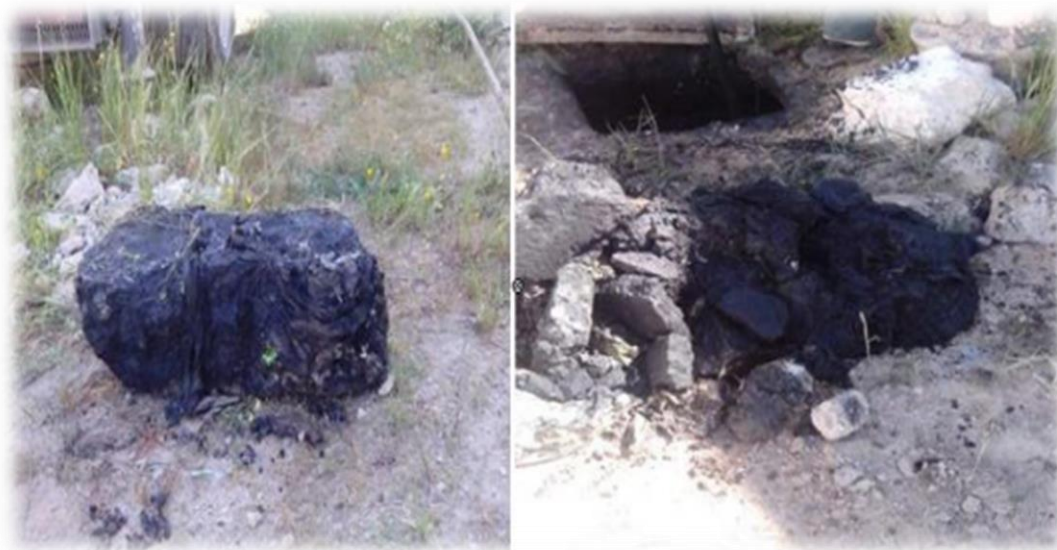
Figure 06 : Blocs de pierre provoqués par les margines extraits d'un réseau d'assainissement à Fès au Maroc (Amrani et Bendidi, 2004)