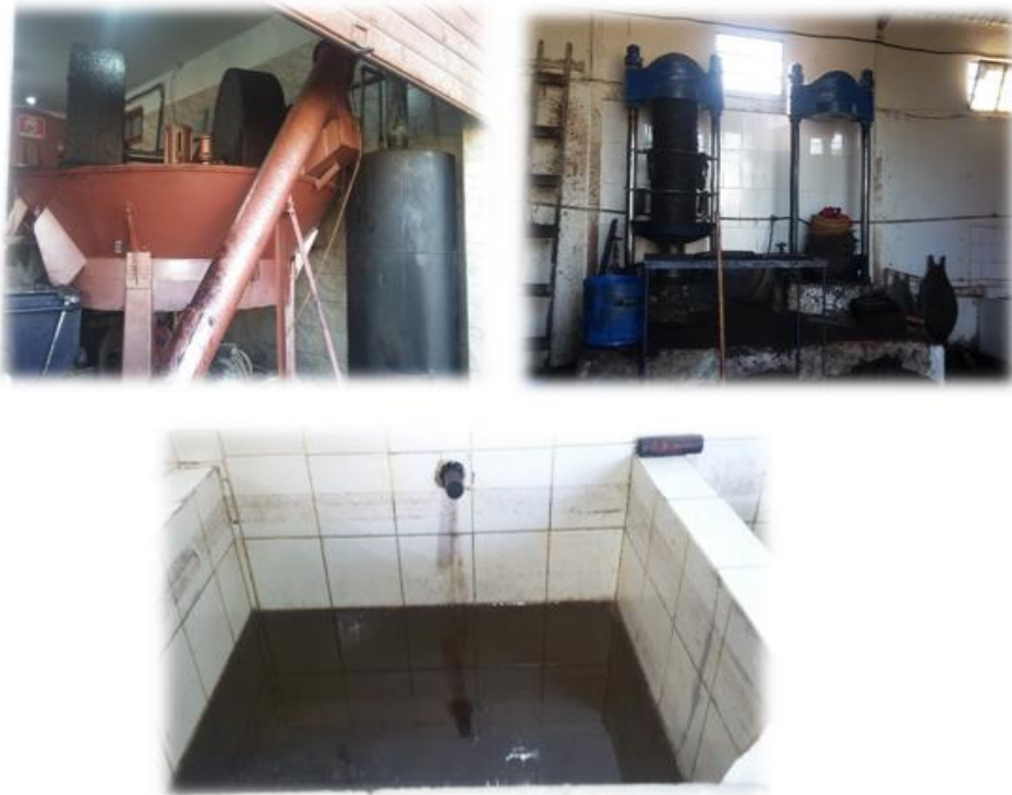
Figure 12 : Etat des lieux au niveau de l'huilerie El Baraka

C'est une unité traditionnelle d'extraction d'huile d'olive. La capacité de production est moins de 2T d'huile d'olives/jour. De même que pour les unités 2 et 3, les phases d'extraction d'huile d'olive au niveau de cette huilerie sont : le tri-lavage, le broyage, le pressage, et la séparation des phases solides/liquides par séparation centrifuge. La figure 12 illustre l'état des lieux au niveau de cette huilerie.