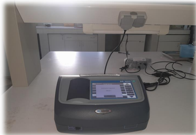
Figure 16 : Spectrophotomètre UV-Visible

Le dosage des nitrates a été effectué selon la norme française (NFT90-012, 2019). En présence de salicylate de sodium, les nitrates donnent du paranitrosouylate de sodium coloré en jaune et susceptible d'un dosage colorimétrique. La lecture a été effectuée en utilisant un Spectrophotomètre UV-Visible de type DR 3900 – 1582948 (Figure 16). Les résultats sont exprimés en (mg/L).