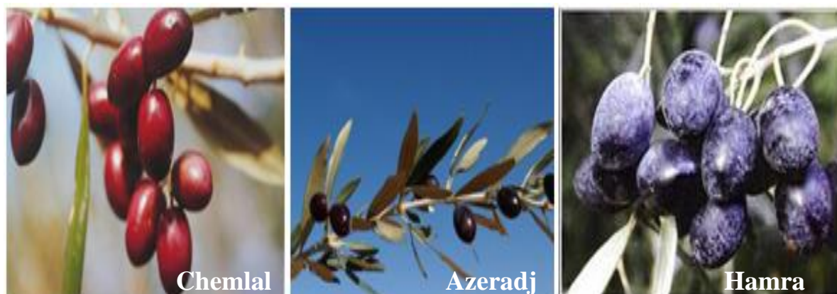
Figure 02 : Les variétés d'olives dans la wilaya de Jijel

- La variété Hamra avec un rendement de 18 à 22%