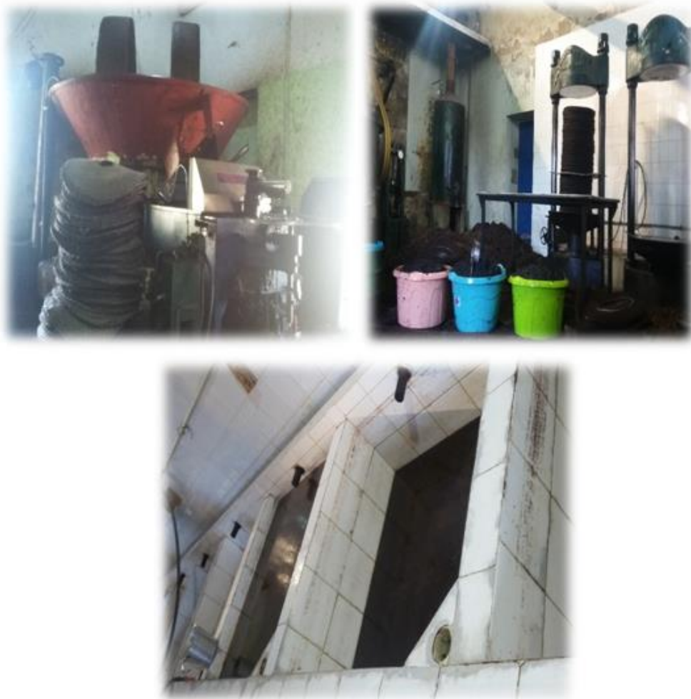
Figure 11 : Etat des lieux au niveau de l'huilerie Abdeli, El Alamia

C'est aussi unité traditionnelle d'extraction d'huile d'olives. Les principales opérations du processus d'extraction d'huile d'olive sont les mêmes que pour l'huilerie 02. La figure 11 illustre l'état des lieux au niveau de cette huilerie.