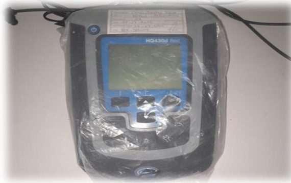
Figure 13 : pH mètre de type (Hach HQ 411d PH/mV)

Le pH est pris avec un pH mètre de type Hach HQ 411d pH/mV (Figure 13), en plongeant l'électrode dans l'eau à environ 6 à 8 cm de la surface. Préalablement à la mesure, le pH mètre est étalonné avec des solutions étalons. Les résultats sont exprimés en unité pH.