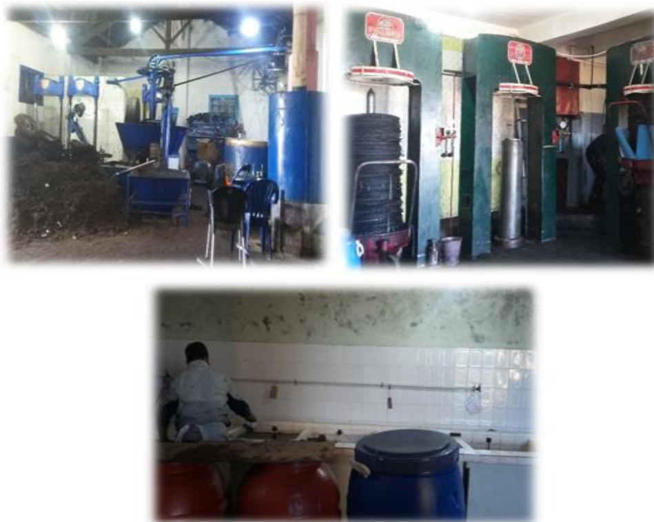
Figure 10 : Etat des lieux au niveau de l'huilerie El barbache

C'est une unité traditionnelle d'extraction d'huile d'olives. Les principales opérations du processus d'extraction d'huile d'olive sont : le tri-lavage, le broyage, le pressage, et la séparation des phases solides/liquides par centrifugation. La figure 10 illustre l'état des lieux au niveau de cette huilerie.