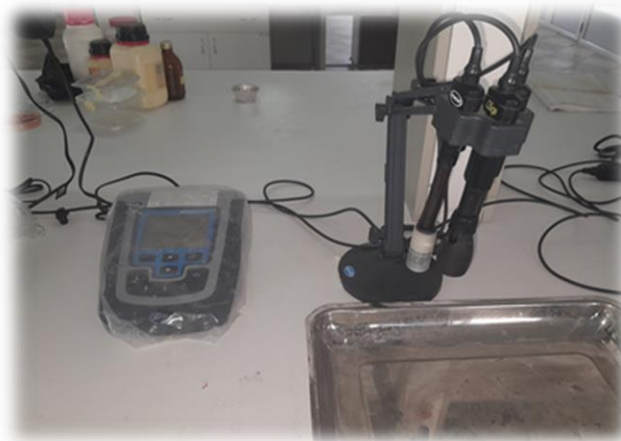
Figure 14 : Conductimètre de type (Hach HQ 430d flexi)

La conductivité électrique est mesurée à l'aide conductimètre de type Hach HQ 430d flexi (Figure 14) en plongeant l'électrode dans l'eau à environ 6 à 8 cm de la surface. Les résultats sont exprimés en \mu\text{S}/\text{cm} .