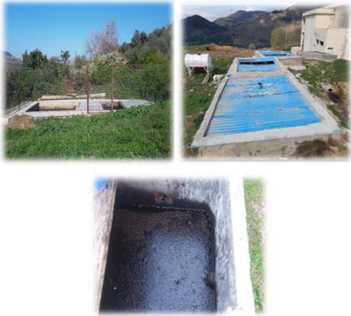
Figure 05 : Bassin de décantation de la margine au niveau de l'huilerie d'El baraka (Kaous)