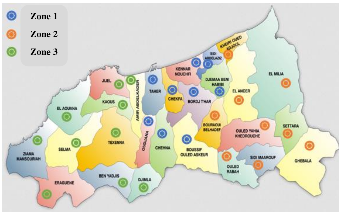
Figure 03 : Correspondance entre localisation des 3 zones oléicoles et découpage administratif de la wilaya de Jijel