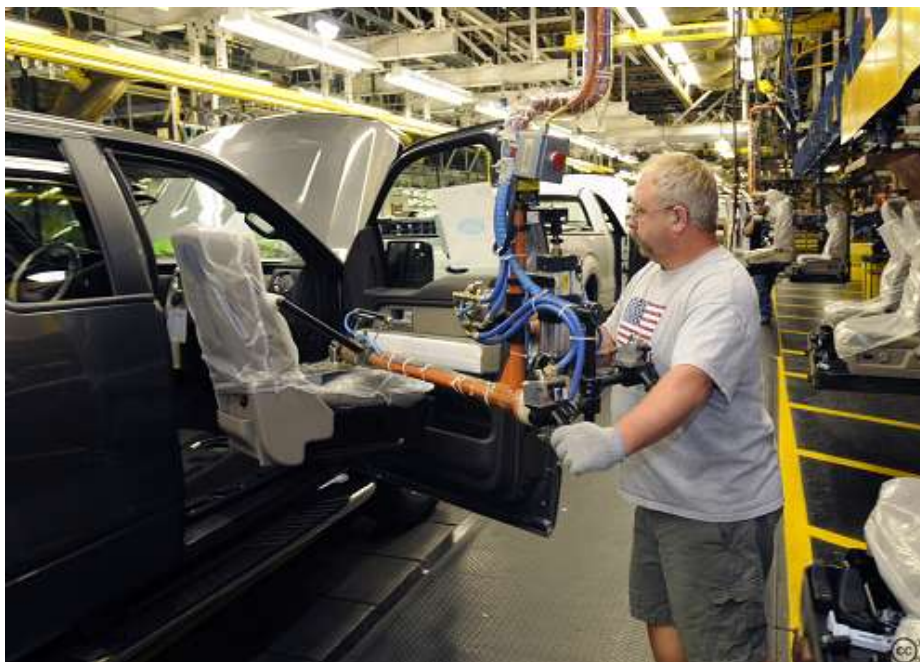
Fig.1. Assemblage final : installation des sièges dans les véhicules automobiles à l'atelier de finition d'une chaîne de production.

Une solution constructive d'assemblage a pour fonction de lier des pièces les unes aux autres, en utilisant différents moyens d'assemblage : Par organe filetés, par collage, par soudage..... (fig. 1).